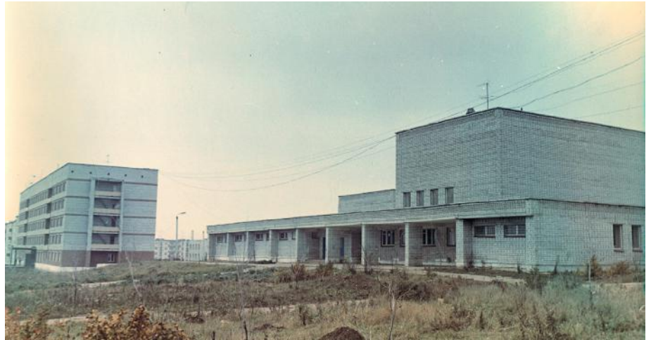
Здание ПТУ-29, 1982 год