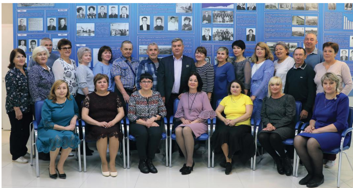
Работники и ветераны АО «Элеконд» - выпускники ПТУ-29 разных лет